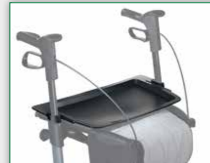
Tablett zum Abstellen oder Transportieren