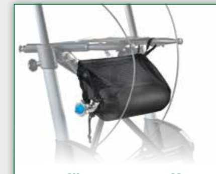
Netz für Sauerstoffflasche