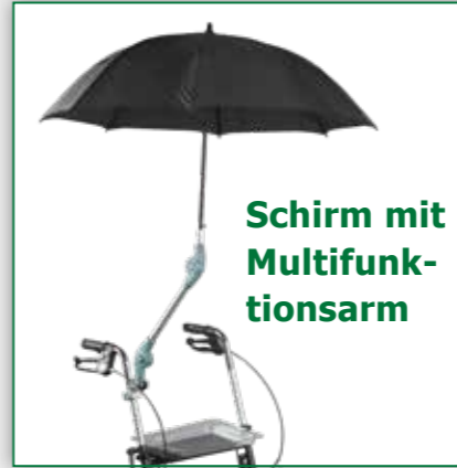
Schirm mit Multifunktionsarm