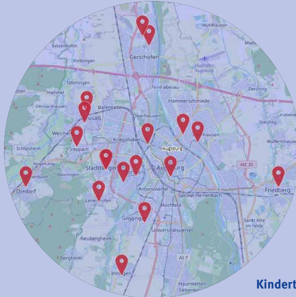
Standorte unserer Kindertageseinrichtungen