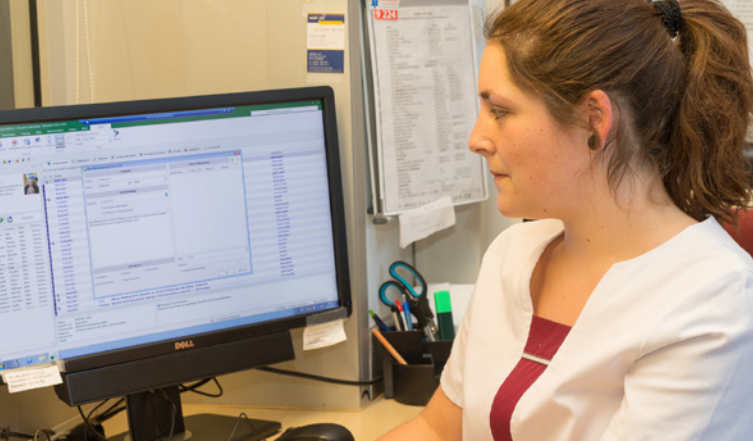
Sie bekommen ein umfassendes Verständnis von Pflege.