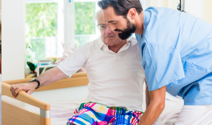
Drei Spezialgebiete in einer Ausbildung