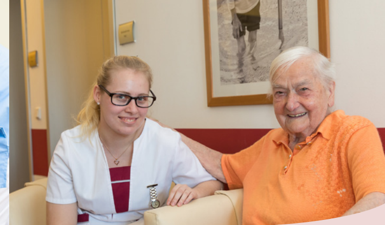
Die dreijährige Ausbildung verbindet optimal Theorie mit Praxis.

D ie neue Pflegeausbildung bereitet ab dem Jahr 2020 auf einen Einsatz in allen Bereichen der Pflege vor. Durch diese generalistische Ausbildung erhalten die Auszubildenden ein umfassendes pflegerisches Verständnis. So können sie sich schnell in die jeweiligen Spezialgebiete mit ihren unterschiedlichen Anforderungen einarbeiten.