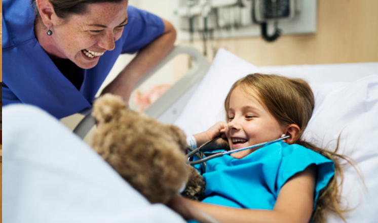
Einsatz in Kranken-, Kinderkranken- sowie Altenpflege